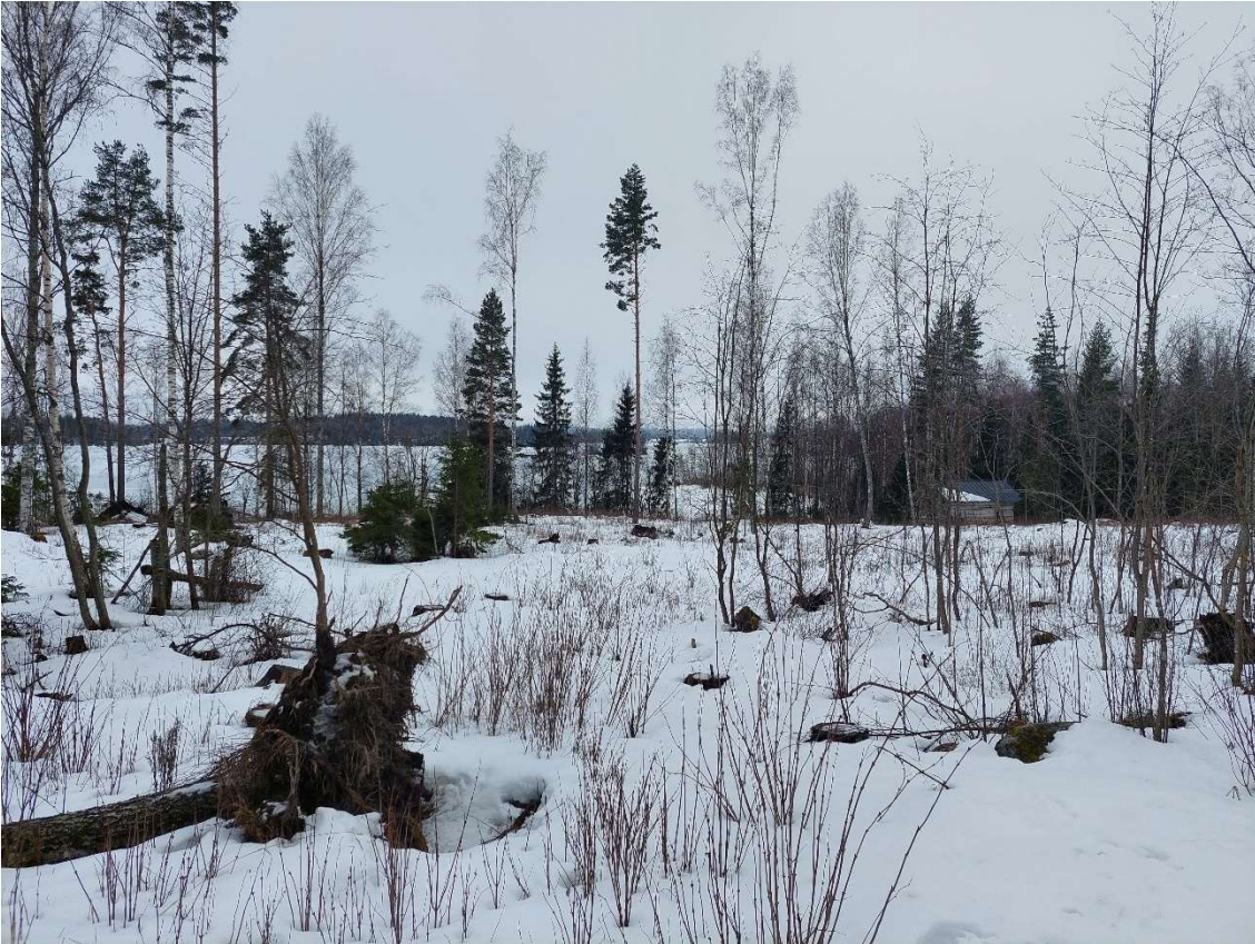
Yläkuvassa kiinteistön 2-38 savusaunan ympäristön hakkuuaukea ja alakuvassa kiinteistön 2-38 Hinsalantien pohjoispuolen taimikko ylispuukoivuineen